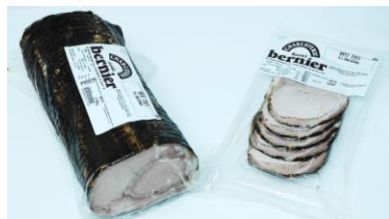
Le rôti à l'ancienne est préparé à partir de la longe (filet) de porc assaisonnée et cuite.